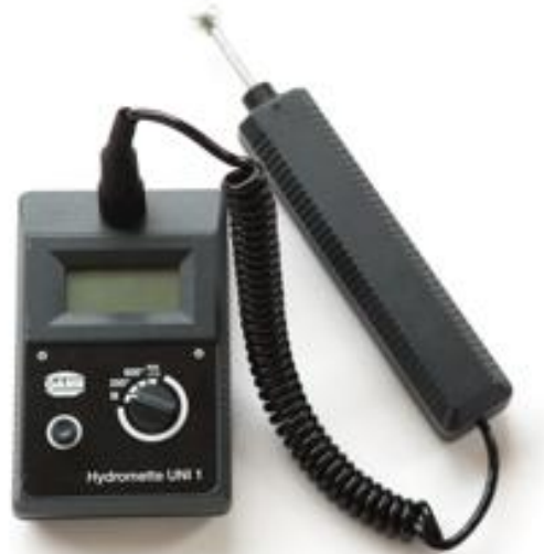
Bild på Gann Hydrometer UNI1