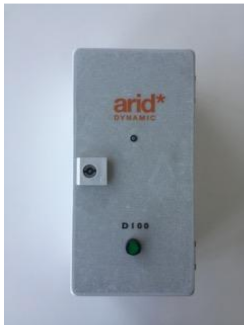
Bild på kontrollbox Arid Dynamic 100 för generering av asymmetriska bipolära pulser.

En kontrollbox (jongenerator), Arid Dynamic 100, installerades tillsammans med en slinga med 22 elektroder. De cylinderformade elektroderna (150 mm långa och 3 mm i diameter) monterades i borrarade hål i betongväggen. Avståndet mellan elektroderna är ungefär 700 mm. Elektroderna placerades i två nivåer. Den ena nivån, med 11 elektroder, monterades i anslutningen mellan väggen och golvplatta. Den andra nivån, med 11 elektroder, monterades ca 1200 mm upp på väggen, ovanför golvplattan.