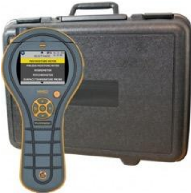
Bild på GE Protimeter MMS2

Då denna metod är relativt komplicerad, undersöktes sambandet mellan mätning med prober och induktiv (icke-förstörande) mätning där mätinstrument läggs mot ytan av väggen. Dessa mätningar gjordes dels med en s.k. Gann-mätare (Gann Hydrometer UNI1) och dels med en s.k. Protimeter (GE Protimeter MMS2).